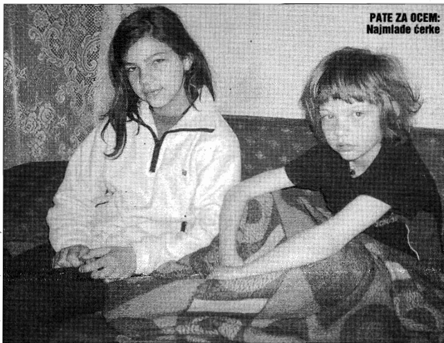
PATE ZA OCEM: Najmlađe ćerke

- Svima sam duboko zahvalna na pomoći - kaže Dragana, držeći pismo u