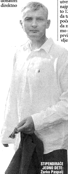
STIPENDIRAO JEDNO DETE: Žarko Paspalj

Naš prijatelj Gojko Savić iz Prištine, koji je već dugo sa nama, bio je na terenu i utvrdio kojoj je deci pomoć najpotrebnija. Za početak je to 12 mališana, a planiramo da taj broj uvećamo. Ovo je početak akcije i nastojimo da za svih 12 mališana nađemo stalne sponzore. Među prvima se javio naš proslavljeni košarkaš Žarko Paspalj, voljan da pomogne mada bismo u jednom mališanu. On će verovatno iznos jednogodišnje stipendije uplatiti odjednom, što je takođe moguće, mada bismo mi više voleli da se stipendije uplaćuju mesečno kako bi deca imala stalan, ali ograničen izvor prihoda. Osim toga, naša organizacija "Božur" će preuzeti sponzoriranje