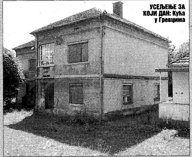
УСЕЉЕЊЕ ЗА КОЈИ ДАН: Кућа у Гревцима

■ Седмочлана породица прогнаника са Космета, захваљујући донацији дијаспоре, и уз подршку нашег листа, добила властити дом од 150 квадрата код Крушевца